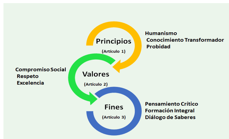
Figura 1. Marco Axiológico de la Universidad Nacional de Costa Rica